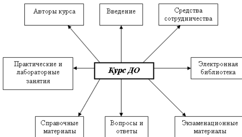
Рис.6.3 Типичная структура курса дистанционного обучения

Типичная структура курса дистанционного обучения представлена на Рис.6.3